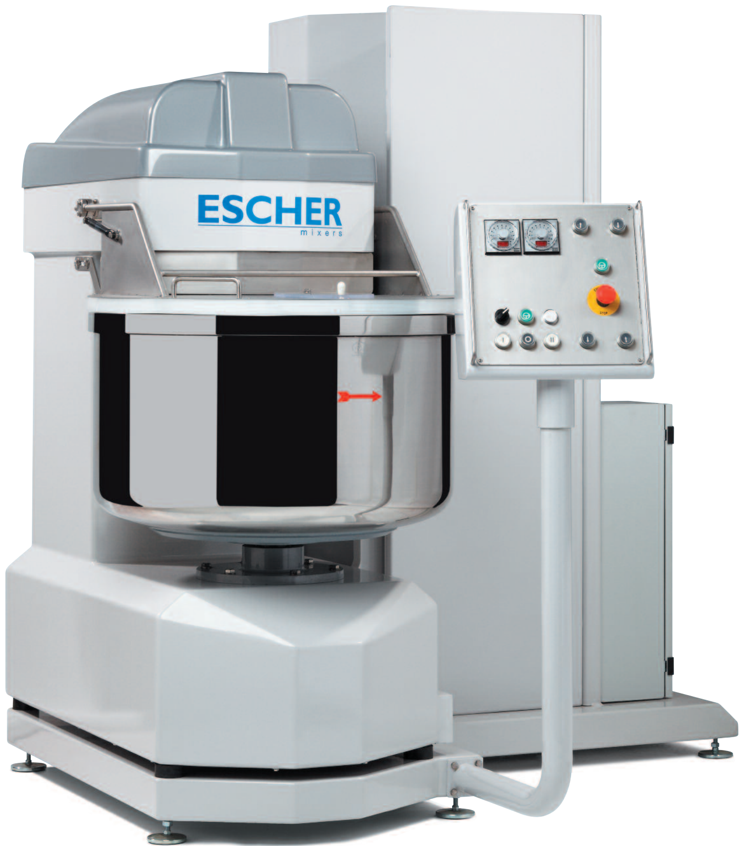
Self-tipping spiral mixers on table or divider Impastatrici a spirale auto-rovescianti su tavolo o spezzatrice Pétrins à spirale auto-basculants sur table ou sur diviseuse